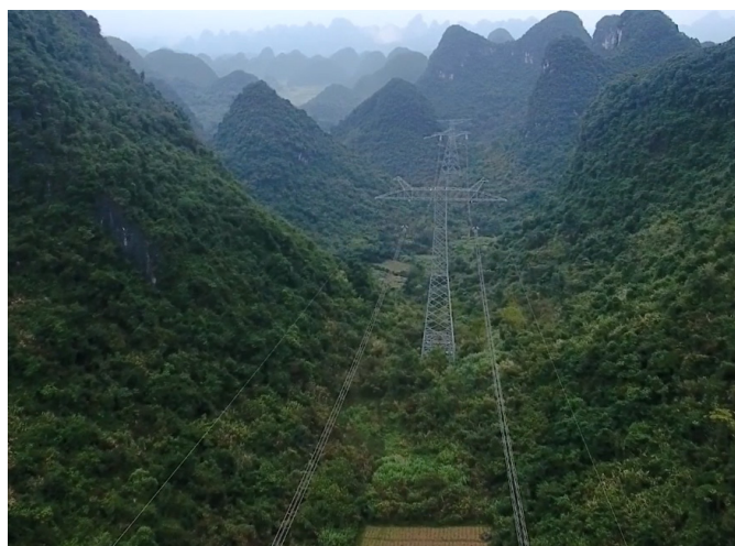
Torre HVDC en China.

Desde Conexión estamos convencidos de la importancia de fortalecer la existencia de biodiversidad en los territorios, como herramienta clave para mitigar el cambio climático, frenar la pérdida de biodiversidad y fomentar el desarrollo rural y urbano sostenible.