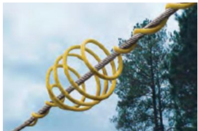
Ejemplos de dispositivos disuasores de vuelo