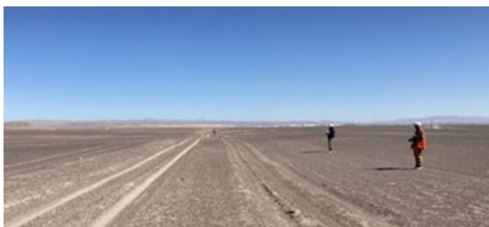
Huellas de carretas de la época de las salitreras (Región de Antofagasta)

Conexión Kimal-Lo Aguirre, ha evitado los principales hallazgos arqueológicos y otros donde no ha sido posible, se solicitará los permisos al Consejo de Monumentos Nacionales y se realizarán las medidas de rescate.