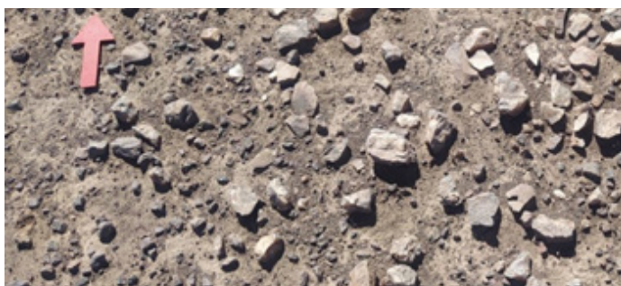
Eventos de talla lítica (Región de Antofagasta y Atacama)