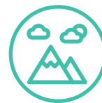
Ecosistemas de montaña