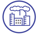
Zonas urbanas altamente contaminadas

Cumplimos con 7 de las 9 características definidas por el panel intergubernamental en cambio climático