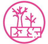
Territorios expuestos a sequía y desertificación

Cumplimos con 7 de las 9 características definidas por el panel intergubernamental en cambio climático