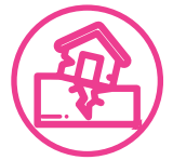
Áreas propensas a desastres naturales