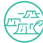
Espacios proclives al deterioro forestal