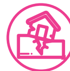
Áreas propensas a desastres naturales