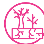
Territorios expuestos a sequía y desertificación

Cumplimos con 7 de las 9 características definidas por el panel intergubernamental en cambio climático