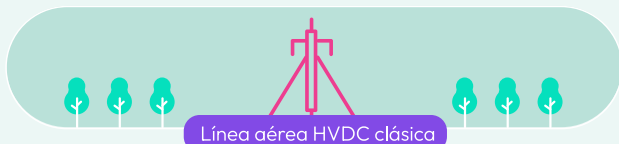
Línea aérea HVDC clásica

AC: Línea corriente alterna, usada en Chile actualmente.