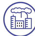
Zonas urbanas altamente contaminadas

Cumplimos con 7 de las 9 características definidas por el panel intergubernamental en cambio climático