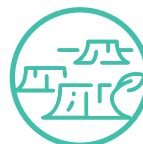
Espacios proclives al deterioro forestal