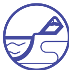
Zonas costeras bajas