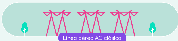
Línea aérea AC clásica

✓ Otra ventaja de la corriente continua es que ocupa menos espacio en el territorio porque su franja de servidumbre es menor.