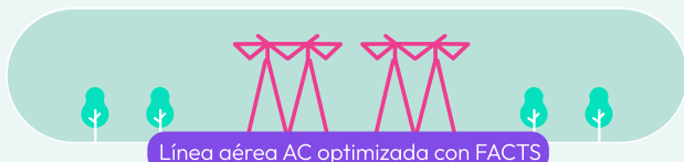
Línea aérea AC optimizada con FACTS